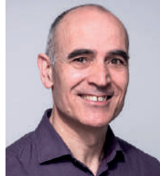
Felix Trejo Engagement in Schule und Kita, Integration und Willkommenskultur, Öffentlichkeitsarbeit