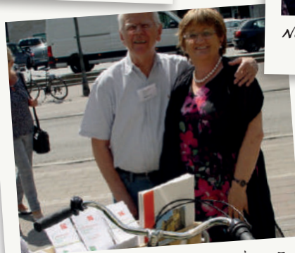
RESI-Einsatz mit Prominenz