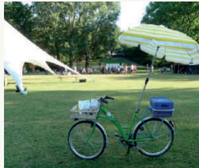
RESI im Übermorgen