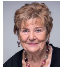
Hella Heidötting Kinderbuchhaus, Leseförderung, Gesundes Frühstück, Musische Erziehung, Fundraising